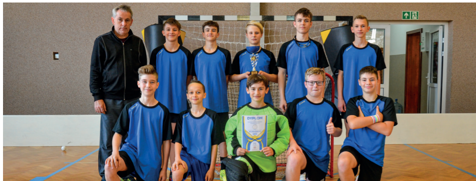
Reprezentacja SP Mroczeń - Mistrzowie Powiatu Kępińskiego rocznika 2008