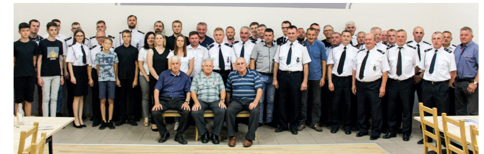
Walne zebranie sprawozdawczo-wyborcze OSP Słupia pod Kępem