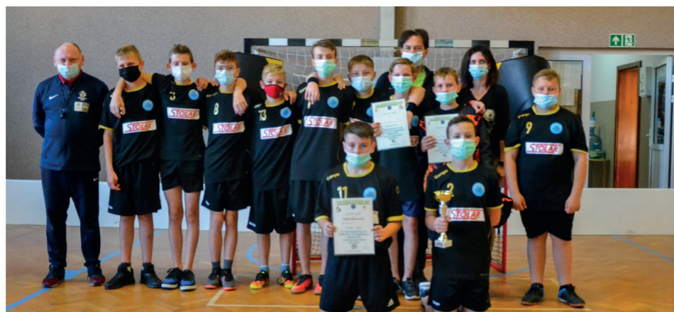
Nie mając hali, jednak wygrali - reprezentacja SP Baranów rocznik 2009