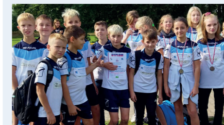
Finaliści Mistrzostw Powiatu w Biegach Przełajowych