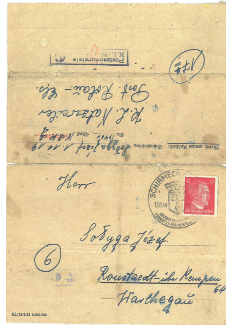
„Można było również w tym dniu pierwszy raz napisać z obozu list do domu.”

Spadły deszcze, górską rzeczka ruszyła, więc można się było umyć, oczywiście bez mydła i bez ręcznika, bo tych luksusów nigdy więźniów obozów koncentracyjnych nie posiadał. Zostaliśmy również ogoleni. Przedtem byliśmy do ludzi niepodobni. Można było również w tym dniu pierwszy raz napisać z obozu list do domu. Oczywiście wszystkim chętnym pisał listy blokowy, który miał czym pisać i po niemiecku umiał. Straszny był przy tym pisaniu bałagan, bo chętnych było wielu, a on sam. To jeszcze szczęście, że ten blokowy to był Polak z Poznania, bardzo dobry człowiek, pomagał nam