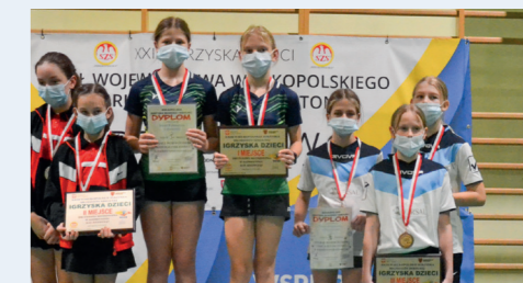
Finalistki Drużynowych Mistrzostw Wielkopolski w Badmintonie