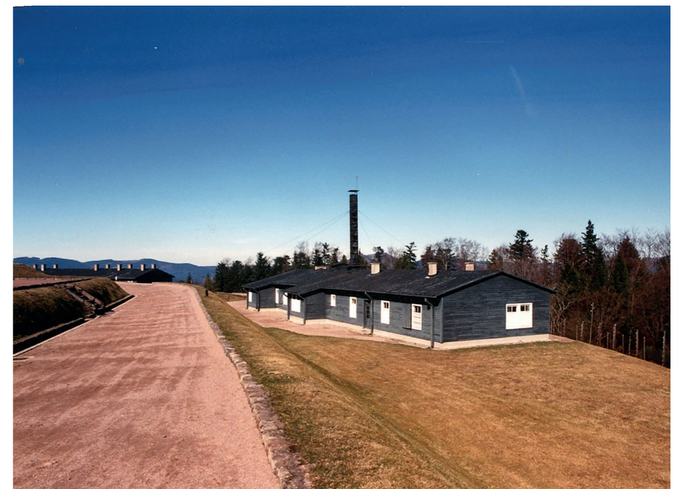
Obozowe krematorium - widok współczesny

Całość na facebook.pl Baranów. Witryna Sołectwa