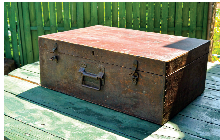
Walizka z Dachau (zdjęcie współczesne)

cięgi i młotek. Opasałem się kablem. Młotek, obcęgi i strug wepchałem za kabel pod pazuchę i na zbiórkę. Wszystko przebiegało na razie po myślnie. Natomiast, gdy przekroczyliśmy bramę obozu nie było komendy rozejść się, tylko cała kolumna szła zwarta do przodu, aż ostatnie piątki przekroczyły bramę i wtedy stój. „Rewizjon!” Około 30 esesmanów przystąpiło do rewizji. Rewizja okazała się rewelacyjna. Absolutna większość Francuzów niosła pod płaszczami na drucie uwiązane po dwa kawałki kantówki, by w czasie wolnym od pracy ugotować sobie na piecu z cegieł (na baraku były dwa) trochę zupy z