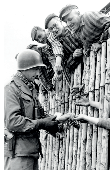
Wyzwolenie więźniów z obozu Dachau

to oni natychmiast włamali się do magazynu odzieżowego, ubrali się w pasiaki i za druty. - Ja, mówi ten znajomy, stoję tu na warcie. Wykorzystali moment, bo za godzinę byliśmy już otoczeni amerykańskimi żołnierzami i wyjście wzbromione. Podobno stało się tak dlatego, że w Buchenwaldzie, po oswobodzeniu obozu, działy się straszne rzeczy, więc dalsze obozy zostały zamknięte. Jedzenie się poprawiło, ale do syta nie było. Zresztą tak wygłodzonego tłumu nie da się od razu dokarmić. No i niezdrowo. Sporo ludzi zaczęło chorować, niejedni przynosili zabrane skądś konserwy, więc jak raz i drugi dobrze się nasycił, to natychmiast choroba.