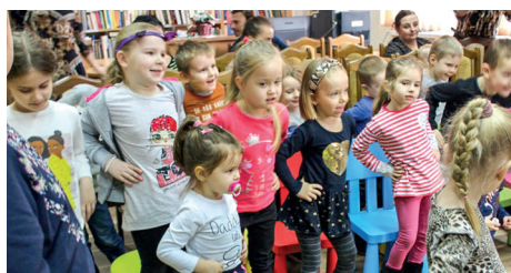
Widownia zachwycona spektaklem