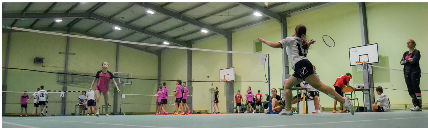
Badmintonowe tornado szaleje w Donaborowie