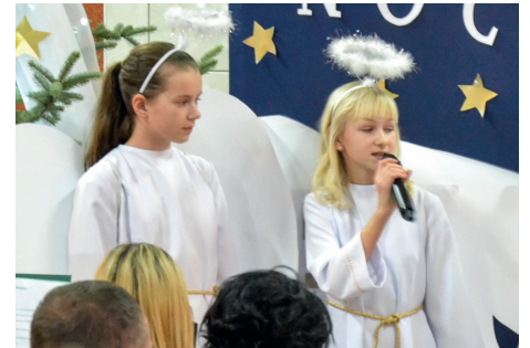
Anielskie jasełka w Mariance Mroczeńskiej