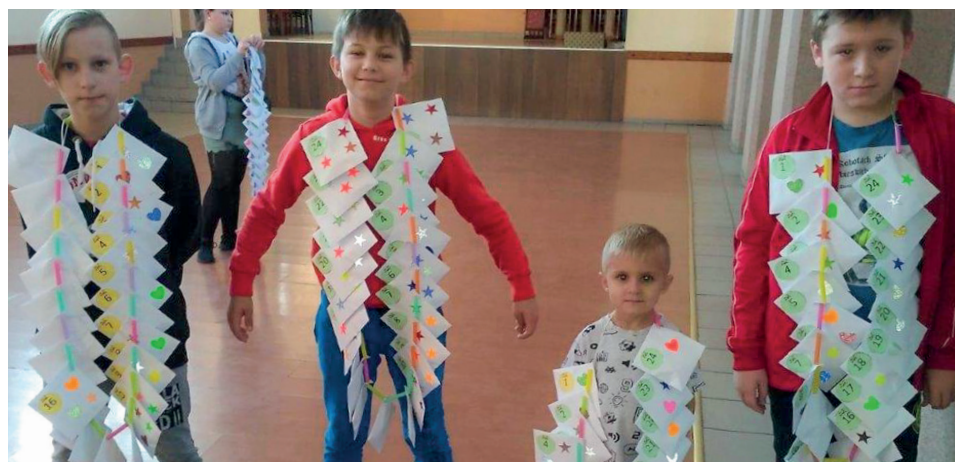
Żywe kalendarze adwentowe

Fantastyczny pomysł Stowarzyszenia Kobiet Aktywnych sprawił, że sala domu ludowego w Słupi na kilka chwil przedzierzgnęła się w świąteczny urząd pocztowy. Przed milusińskimi z naszej Gminy postawiono zadanie wykonania kalendarzy adwentowych. Każde dziecko musiało wyciąć i na-