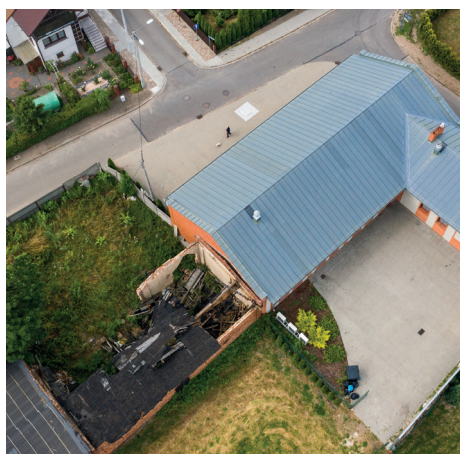
Rozsypująca się stodoła wkrótce zmieni oblicze

poczęła się chwilę po godzinie 19 00 i już podczas pierwszego tańca zauważyć można było, iż zgromadzeni przedsiębiorcy wraz z partnerkami oczekiwali momentu, aby wejść na parkiet i rozpocząć dobrą zabawę. Karnawałowy klimat zapewniły znane i lubiane przeboje w wykonaniu kapeli „Zimne Frytki” z Dolnego Śląska. (ems)