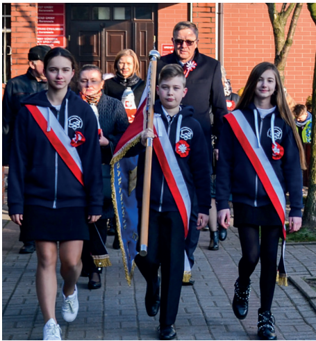
Przemarsz pocztu sztandarowego pod Pomnik