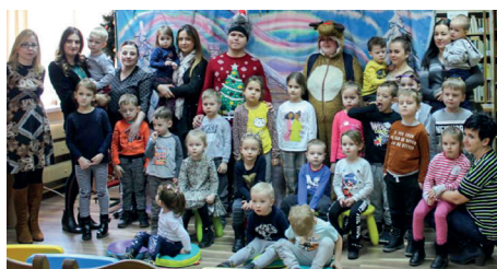
Dzieci i opiekunowie koniecznie chcieli sobie zrobić pamiątkowe zdjęcie z teatralną trupą

Przedstawienie odegrane przez aktorów z Teatru „Błasany Bębenek” obejrzała najmłodsza czytelnicy biblioteki oraz