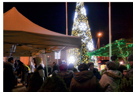
Kolejka po smażone oscypki z żurawiną i rozgrzewającą herbatę