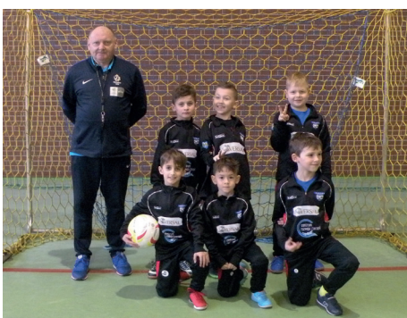
Zespół Żaków „Pioniera” Baranów