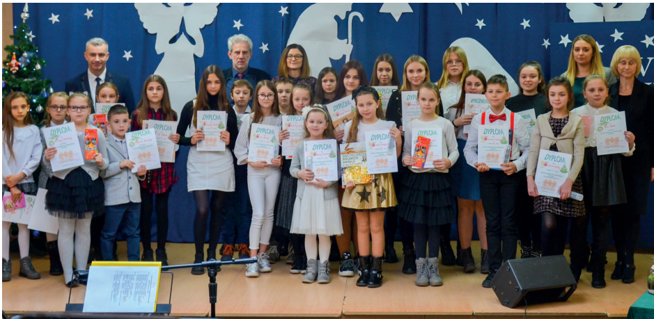
Laureaci XVII Gminnego Konkursu Kołęd w Łęce Mroczeńskiej