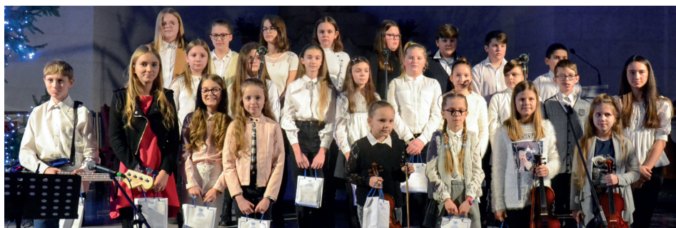
Kolędująca młodzież z całej Gminy doskonale odtworzyła świąteczny nastrój