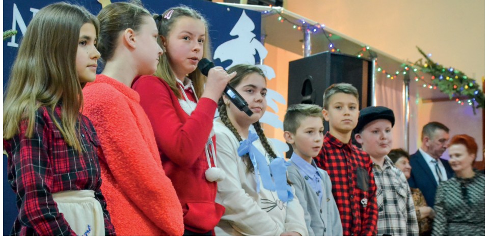
Jasełka w wykonaniu młodzieży ze Szkoły Podstawowej w Łęce Mroczeńskiej