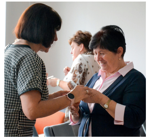
Zgodnie z tradycją podzielono się opłatkiem