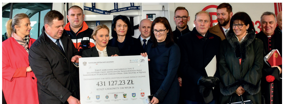
Nasza Gmina dołożyła trzecią co do wielkości cegiełkę

Zakup karetki typu P to następstwo podpisanej 13 grudnia 2019 roku umowy przyznającej powiatowi kępińskiemu dofinansowanie z rezerwy ogólnej budżetu państwa. Pozyskane dofinansowanie stanowi 80% kosztu zakupu karetki. Nowa kosztowała 538 909,04