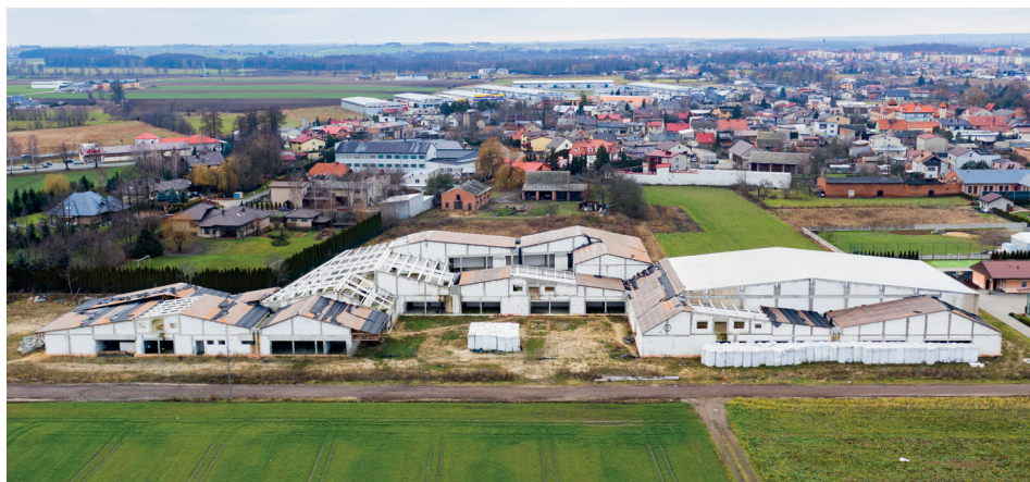
Budowa kompleksu oświatowo - sportowego w Baranowie. Styczeń 2020 r.