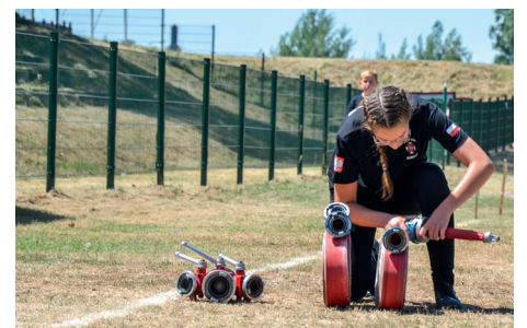
Druhowie z OSP również otrzymują dofinansowanie

Baranów” 10 organizacji będzie realizować zadania za łączną kwotę 360 000,00 zł. Z kolei 4 oferty dotyczyły realizacji zadań z „Upowszechniania kultury”, w powyższym priorytecie kwota przeznaczona na realizację zadań wynosiła 40 000,00 zł natomiast kwota rozdysponowana na ten cel wynosi 20 860,00 zł. Z 14 złożonych ofert przez organizacje pozarządowe komisja konkursowa wskazała do realizacji wszystkie projekty, które uzyskały akceptację Wójta Gminy Baranów i będą realizowane w okresie od 1 lutego do 16 grudnia 2020 r. Organizacje pozarządowe otrzymały wsparcie m. in. na organizację biegu długodystansowego na terenach leśnych osiedla Murator. Piłkarskie emocje towarzyszyć będą nam na boiskach w Słupi pod Kępem, Jankowach, Grębaninie, Mroczeniu oraz na baranowskim Orliku. Panie, panowie oraz dzieci będą mogli uczestniczyć w biegu dla maluchów, zajęciach krav magi, czy też