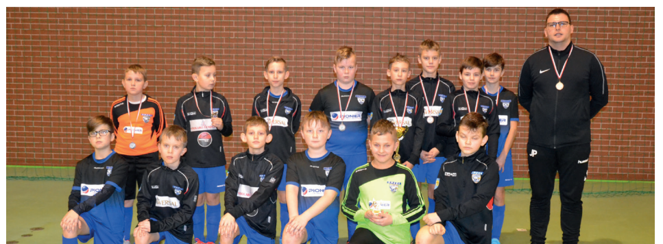
„Orzeł” Mroczeń - drużyna Młodzików