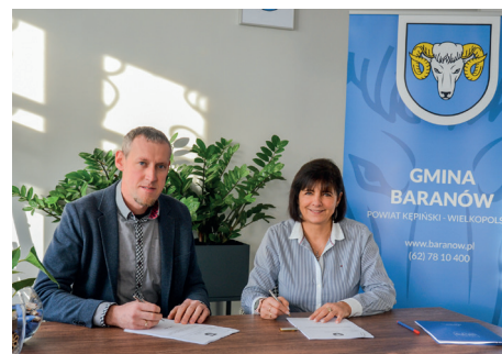
Podpisanie umowy na dokończenie konstrukcji zadania - 14.01.2020 r.