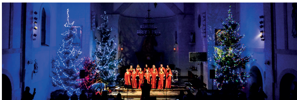
Występ Chóru Gospel zrobił nie lada wrażenie

Parafia Miłosierdzia Bożego w Baranowie należy do najmłodszych w diecezji kaliskiej. Utworzona została w 2006 r. Miejscowy kościół wyróżnia się cudowną akustyką co stanowi niebagatelną powód, by co roku, już od kilku lat, organizować tu wspaniałe spotkania z muzyką świąteczną. W Gminnym Kolędowaniu biorą udział nie tylko parafianie z Mu-