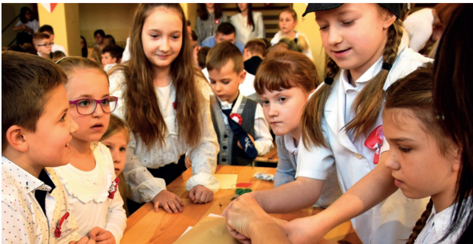
Zadania sprawdzały...