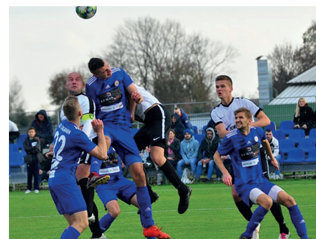
GKS Grębanin - zdobywcy Okręgowego Pucharu Polski w 2019 r.