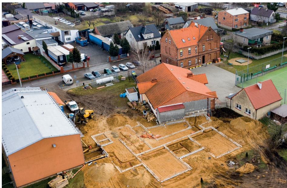
Plac budowy nowego przedszkola w Słupi pod Kępem Styczeń 2020 r.