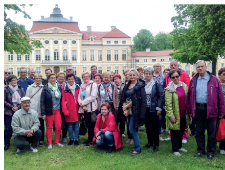
Seniorzy na wycieczce krajoznawczej dofinansowanej z budżetu Gminy