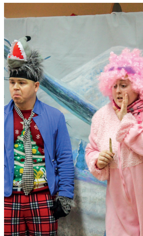
Teatralne stroje potrafią być baaardzo kolorowe