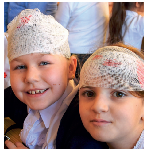
...wiedzę o historii Powstania