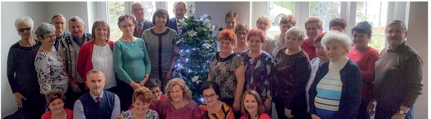
Uczestnicy Wigilii w Klubie Seniora