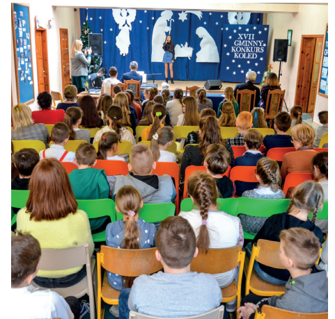
Taka publiczność to skarb