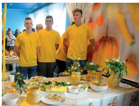
V Lokalny Festiwal Smaku w Mroczeniu. Młodzież uczy się mistrzowskiej kuchni