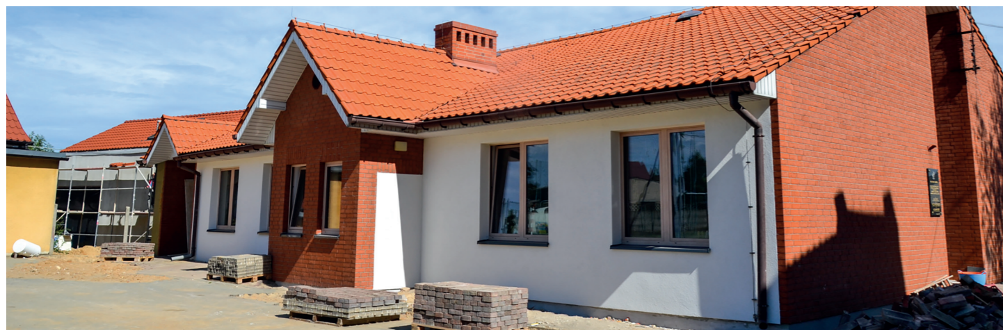
Odnowiona elewacja istniejącego budynku Przedszkola w Stupi p. Kępnem