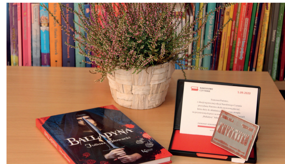
Chętnych do uzyskania pieczęci zachęcamy do skorzystania z tej możliwości w bibliotece