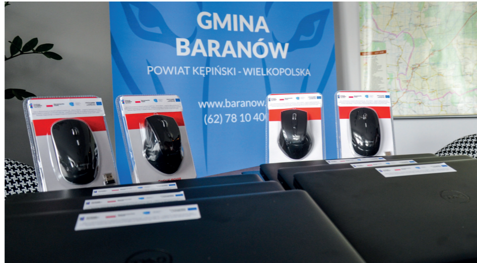
Sprzęt komputerowy trafił do szkół

Gmina Baranów otrzymała dwa granty („Zdalna Szkoła”, Zdalna Szkoła+) na zakup sprzętu komputerowego dla szkół.