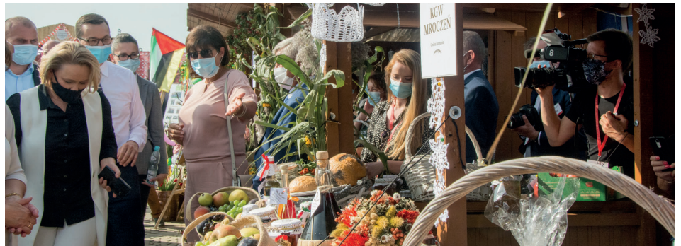
A na Pólku...