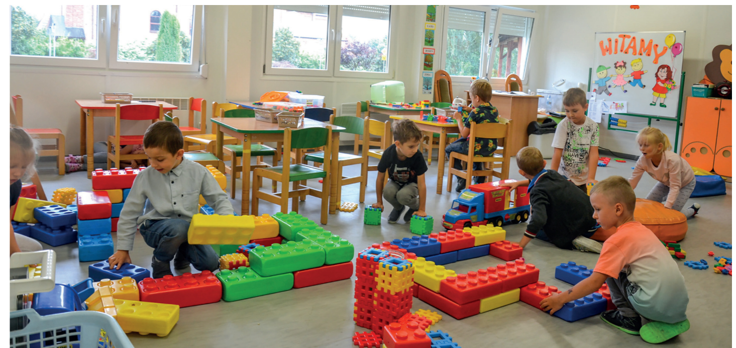
Przedszkolaki w modułach na Muratorze