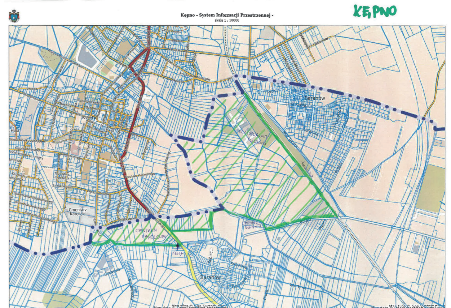
Mapa z zaznaczonym (kolorem zielonym) prognozowanym zasięgiem powiększenia granic administracyjnych Miasta i Gminy Kępno o tereny należące do Gminy Baranów

biorców z Mianowic, którzy płaciliby niższe podatki oraz mogli liczyć na realne inwestycje drogowe do swoich posesji, których na obecną chwilę ich władz nie potrafi zrealizować.