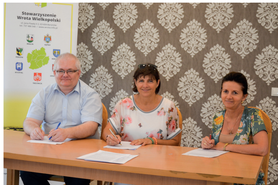
Kolejny grant dla naszej Gminy

Wójt Gminy Baranów podpisał 21 lipca umowę na projekt grantowy w ramach konkursu ogłoszonego przez Lokalną Grupę Działania Wrota Wielkopolski