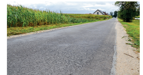
Droga gminna w Donaborowie

nr G852540P - Trakt Napoleoński w Baranowie, w rejonie skrzyżowania z ul. Lisiny. Warto również odnotować fakt remontu nawierzchni bitumicznych na wielu drogach w naszej Gminie. Końcowy odbiór robót odbył się 27 sierpnia.