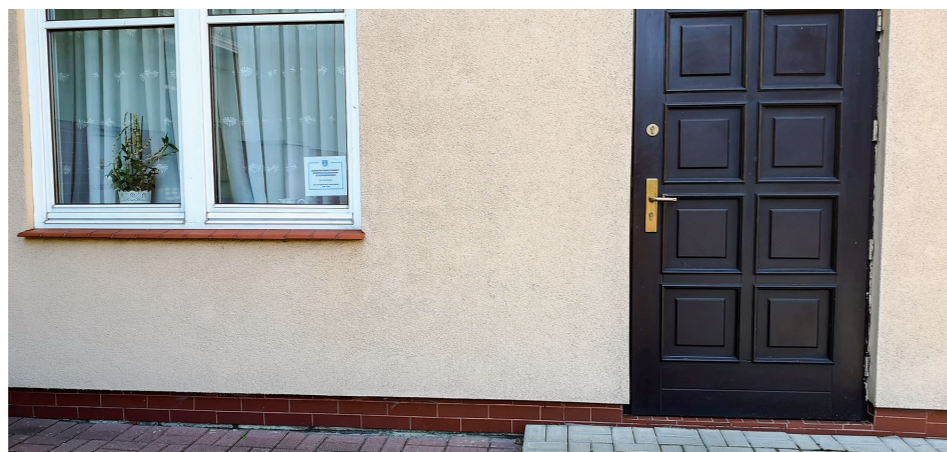
Wejście do punktu pomocy od strony parkingu przy OSP Baranów