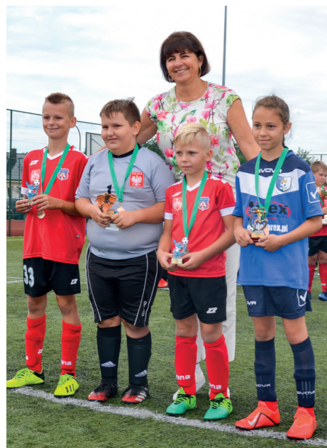
Wyróżnieni w sobotę