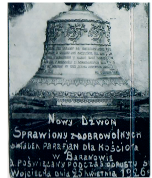
Niemcy ukradli również ten dzwon