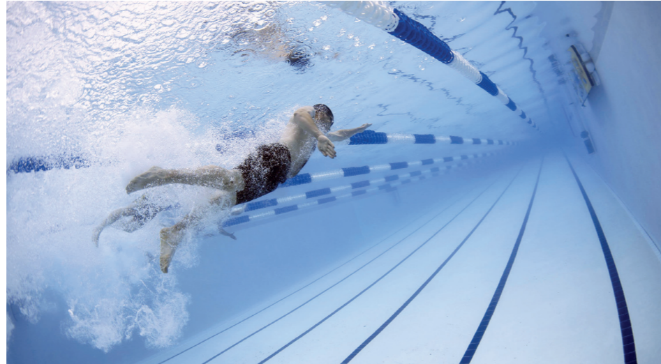
Umiejętność pływania przydała się podczas wakacji

Program powszechnej nauki pływania „Umiem Pływać” realizowany jest na terenie naszej Gminy od wielu lat. W tym roku pandemii koronawirusa przeważała realizację programu w jego połowie