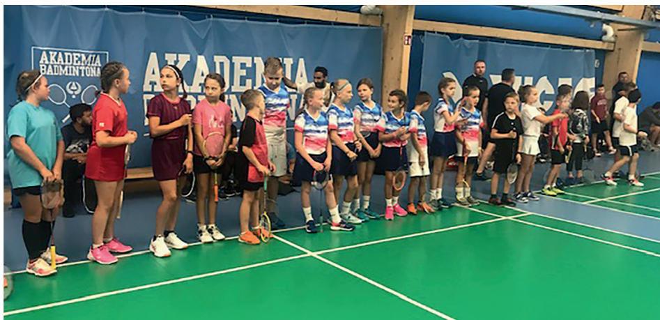
Rozpoczęliśmy wreszcie rywalizację na kortach

W sierpniu (22-30) wzięliśmy również udział w dużym obozie badmintonowym w Białce Tatrzańskiej. To był bardzo intensywny tydzień. Dwa treningi dziennie na hali, spacer w górach i jaskiniach, fitness, termy, trening na 270 schodach w Niedzicy. Oprócz tego