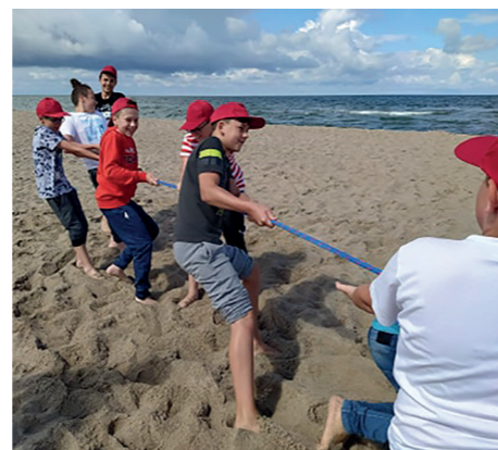
Dzieciństwo bez skazy