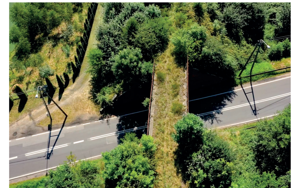
Wiadukt w Mroczeniu - być może właśnie tędy już wkrótce pojedziemy rowerem