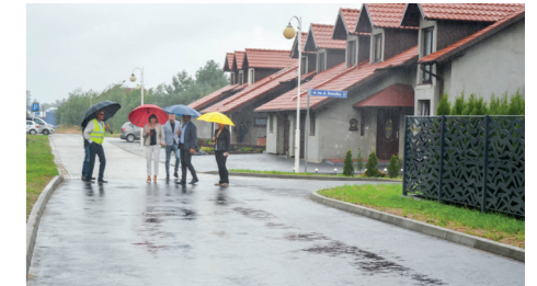
Ul. Wyszyńskiego na Muratorze

nanie analizy odrębnych opracowań projektowych; opracowanie opinii dendrologicznej; inwentaryzację obiektu kolejowego – uzgodnienie z GDDKiA lokalizacji ścieżki rowerowej na wiadukcie kolejowym; pozyskanie opinii kon-