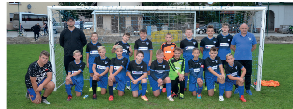
Zespół kat. Młodzik „Orla” Mroczeń wygrał pierwszy mecz ligowy 15:0

Znakomicie rozpoczęły piłkarską jesień zespoły z Mroczenia i Baranowa. Seniorzy „Orła” Mroczeń zajmują po sześciu kolejkach 3. miejsce w lidze, natomiast żaki i skrzaty „Pioniera” przywiezły z turnieju w Koźminie 3. i 5. miejsce. Orliki wygrały Puchar Wójta