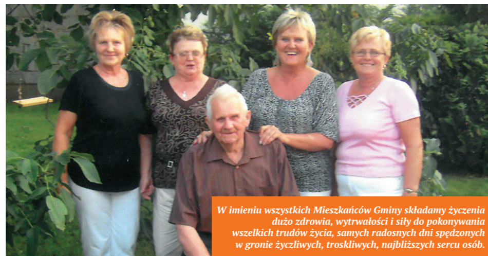
W rodzinnym gronie