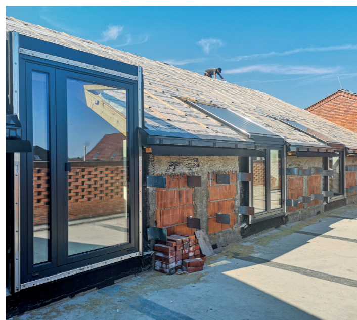
Na tarasie rozbudowywanej Baranowskiej Chaty