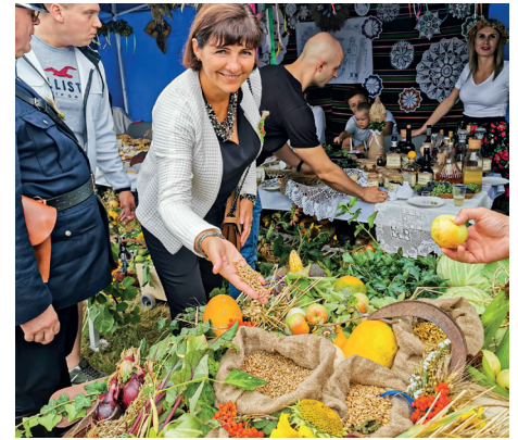
W braterskim Baranowie...