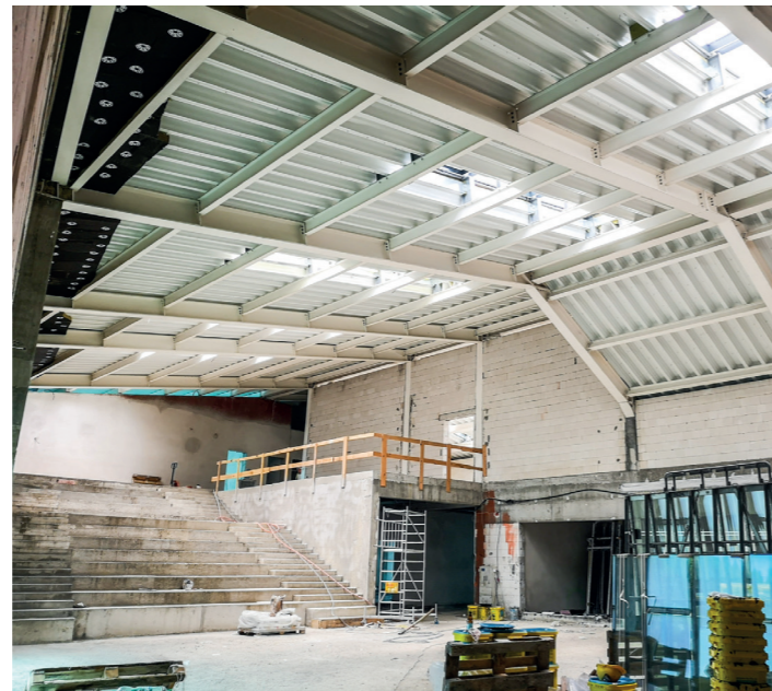
Kompleks sportowo-oświatowy w Baranowie od środka