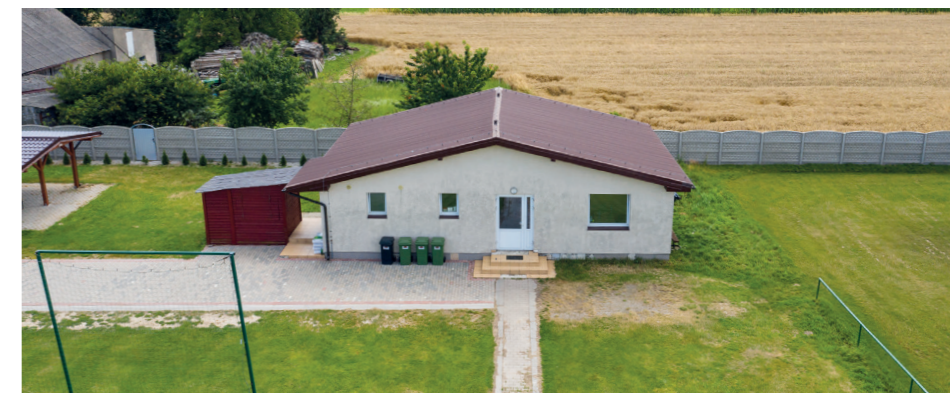
Obecny stan szatni w Słupi p. Kępnem