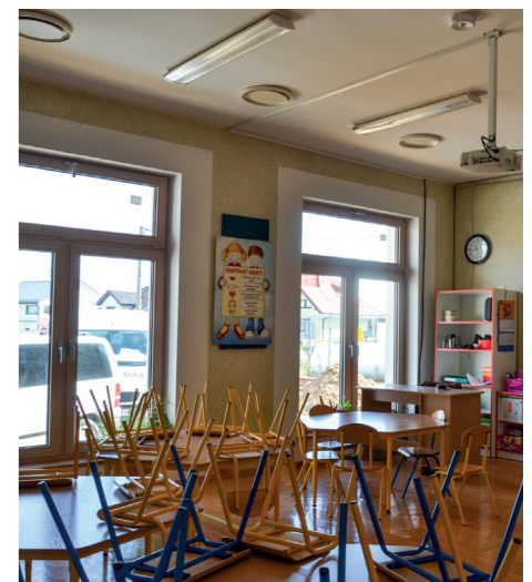
W słupskim przedszkolu wymieniono okna