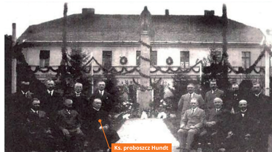
Zdjęcie archiwalne - odsłonięcie pomnika poświęconego ofiarom I wojny światowej - czerwiec 1933 r.

parafian, którzy mogliby go wspomóc, nikt go tam nie znalazł i on nikogo. Mieszkanie także kępskie, bo nie mieszkał w Doruchowie na probostwie, ale poza wioską - w młynie.