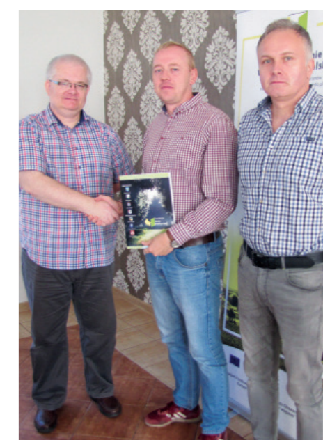
Zarząd „Orla” zrobił pierwszy krok