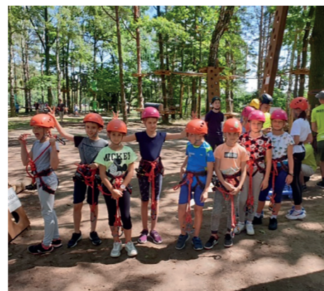
Tornado w... Turawie