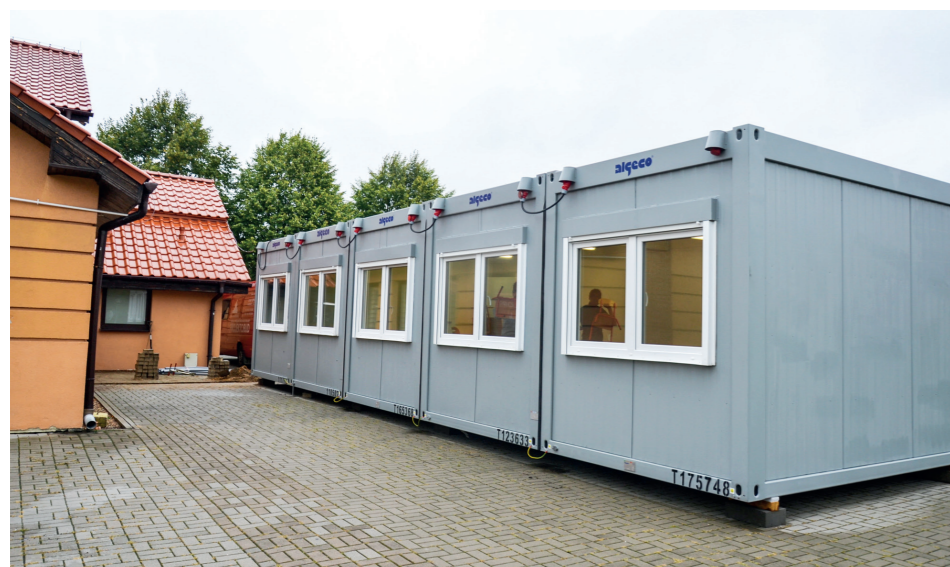
Moduły na Muratorze

20 sierpnia Wójt Gminy Baranów zawarł umowę z gdańską firmą Algeco Polska na wynajem specjalnych modułów, które przez najbliższy rok służyć będą najmłodszym uczniom Szkoły Podstawowej w Baranowie jako tymczasowe klasy.