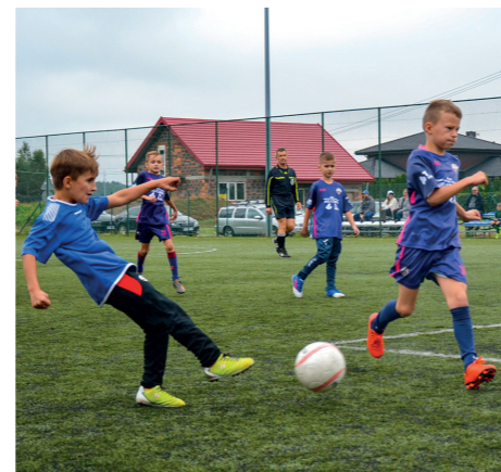
Niedzielne zmagania najmłodszych