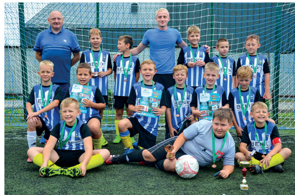
W niedzielę wygrały Orliki „Pioniera”