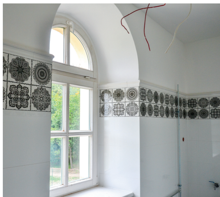
Remont łazienek w pałacu w Mroczeniu