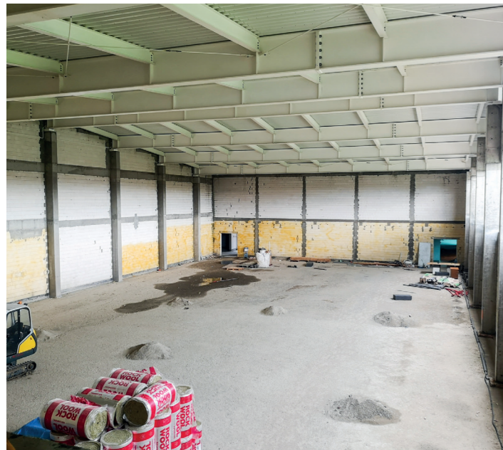
Wnętrze powstającej hali sportowej w Baranowie